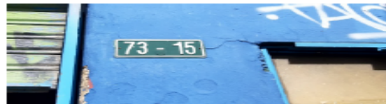
FOTOGRAFÍA No 2. Nomenclatura urbana del establecimiento.