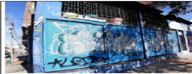
FOTOGRAFÍA No 1. Fachada del predio.