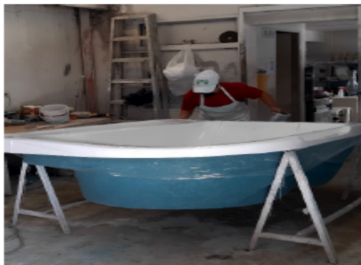
FOTOGRAFÍA No 3. Área de proceso de lijado