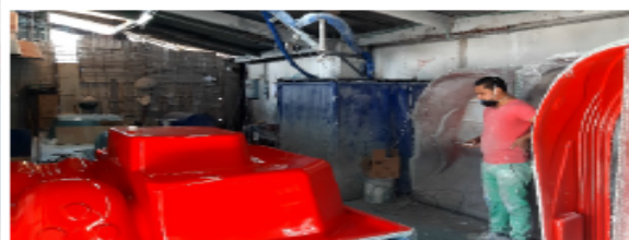
FOTOGRAFÍA No 8. Área de aplicación de resina.