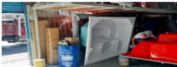
FOTOGRAFÍA No 5. Interior del establecimiento