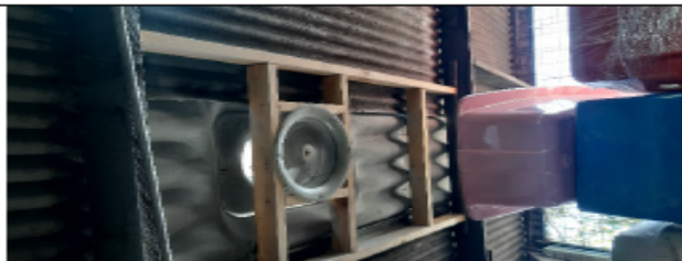
FOTOGRAFÍA No 7. Extractor