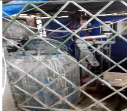
FOTOGRAFÍA No 6. Expansora