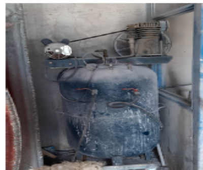
FOTOGRAFÍA No 4. Compresor